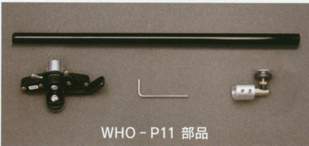
WHO - P11 部品