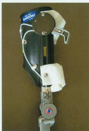
レバーをさげるとロック